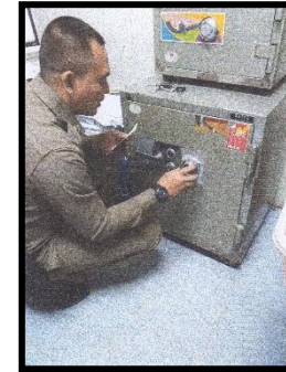
การจัดเก็บรักษาเงินสดและอาวุธปืนของกลาง

สถานที่และวิธีการเก็บรักษาของกลางแต่ละประเภท