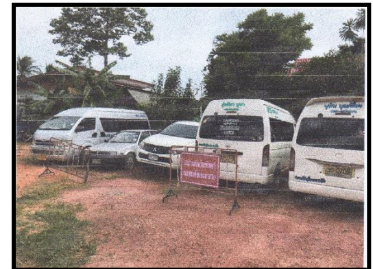
สถานที่เก็บรักษารถยนต์ของกลาง สภ.ท่าฉาง